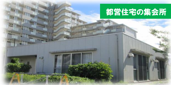
都営住宅の集会所

地域の交流を深める 居場所づくり に都営住宅の 集会所を活用してみませんか？ 公社が主催者と自治会との橋渡し を行います！