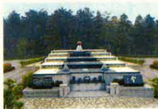
慰霊堂(埼玉県入間郡毛呂山町)