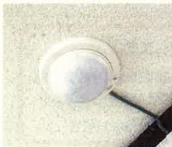
(直径約 15cm 設置イメージ)