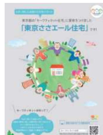
セーフティネット住宅の愛称を「東京ささエール住宅」に決定 (令和2年1月)