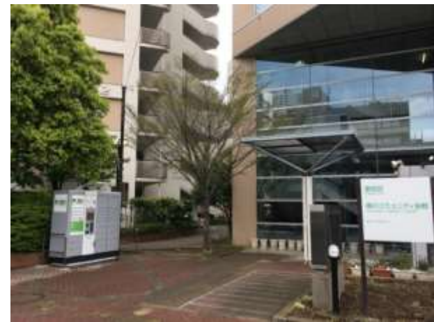
②横川五丁目第2アパート (墨田区横川コミュニティ会館横)