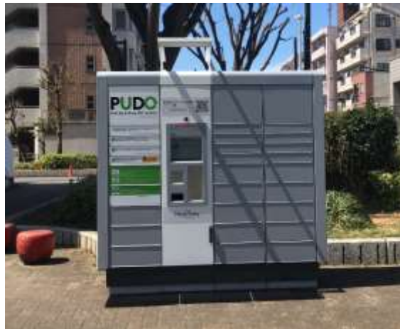
①柳沢六丁目アパート