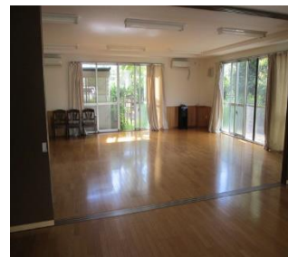
<都営住宅集会所内イメージ>

電子メール申請(minnadesalon@to-kousya.or.jp)及び郵送申請