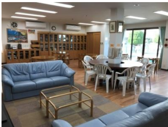
【コミュニティホール】