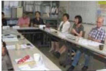
【深谷台地域運営協議会の様子】