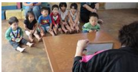
【すぎの子会：2歳児の教室】

概要：就労等で昼間に保護者がいない家庭の子供が放課後を過ごす場を提供するとともに、健全育成を担う事業を実施