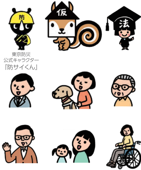
東京防災 公式キャラクター 『防サイくん』